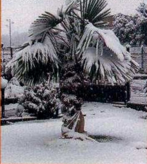
Palma Trachycarpus fortunei snáší dobře i mráz

První palmu Trachycarpus fortunei jsem si dovezl před pěti lety z Německa, vysadil jsem ji v březnu 2003. Byla již asi 2,5 metru vysoká. Palma Trachycarpus fortunei pochází ze severní Číny z podhůří Himálaje, kde roste až do výšek 2400 metrů nad mořem. Je jednou z nejodolnějších palm a bez poškození snese i mráz -17 °C. Pod tuto hranici je již nutno počítat s větším či menším poškozením listů nebo i ztrátou celé rostliny. Záleží na genetické výbavě, velikosti, složení půdy, stanovišti, vlhkosti, množství srážek, minimální teplotě atd.