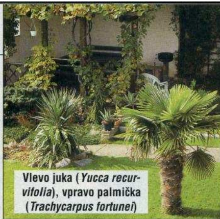
Vlevo juka ( Yucca recurvifolia ), vpravo palmička ( Trachycarpus fortunei )