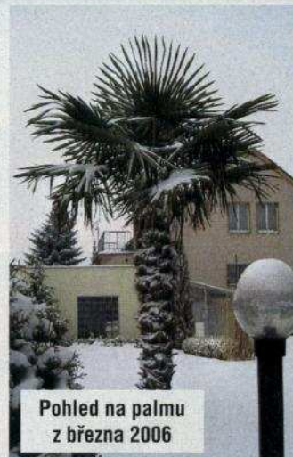
Pohled na palmu z března 2006