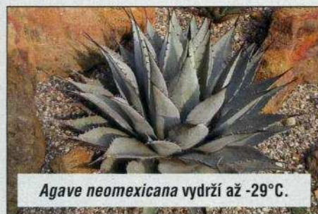
Agave neomexicana vydrží až -29^{\circ}\text{C} .

když v polovině února venku vykopával jámu o hloubce asi 80 cm a pak do ní sázel palmu. Sám přiznává: „Měl jsem sice nastudováno z internetu, že určitě vydrží velký mráz, ale následující zimu jsem se o ni bál.“ V tom roce také uhodily velké mrazy, až